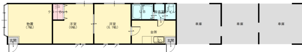
1階 平面図 S:1/100